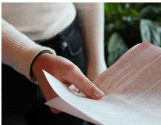
5 Subsidies en tegemoetkomingen